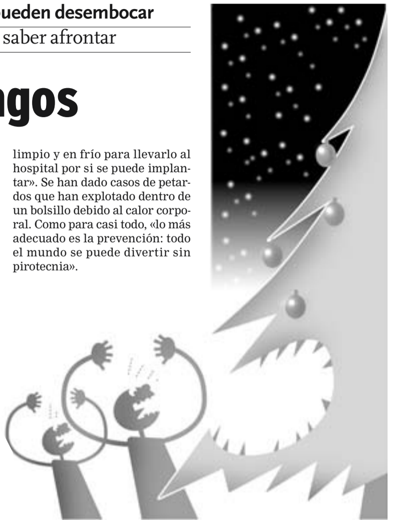
GRÁFICO: JAVIER ZARRACINA

limpio y en frío para llevarlo al hospital por si se puede implantar». Se han dado casos de petardos que han explotado dentro de un bolsillo debido al calor corporal. Como para casi todo, «lo más adecuado es la prevención: todo el mundo se puede divertir sin pirotecnia».